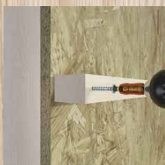
Bevestiging van regelwerk t.b.v. installaties