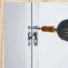
Bevestiging van beslag