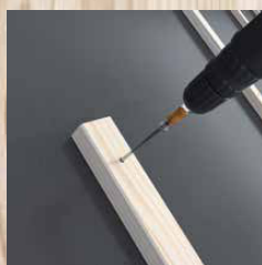
Isolatiemateriaal op dakspanten