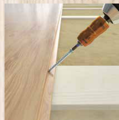
Vastzetten van vloerplanken